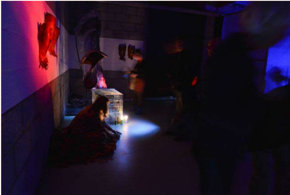
'In space, no one can hear you scream' Installatie in Loods 32 2013