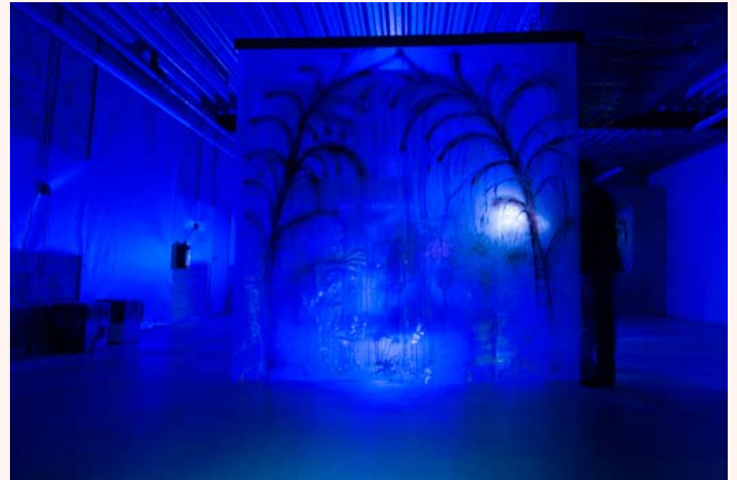
'In space, no one can hear you scream' Installatie in Loods 32 2013