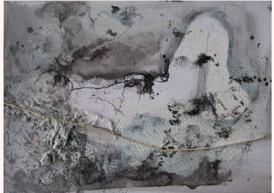
Ik zag dood