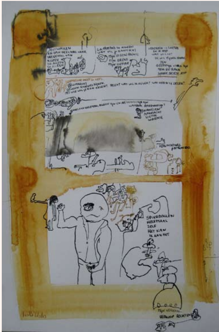
6 maart 2013