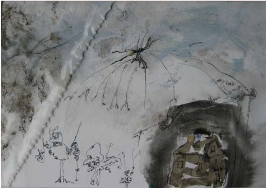
My home is my castle