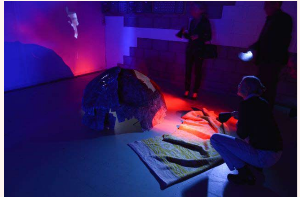
'In space, no one can hear you scream' Installatie in Loods 32 2013