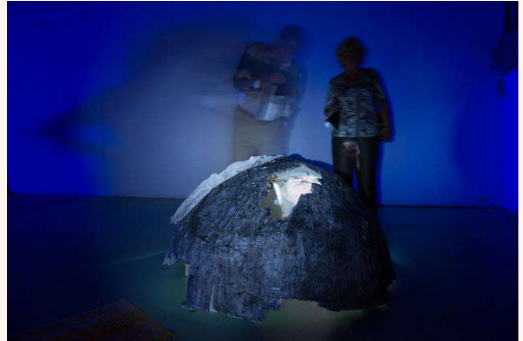
'In space, no one can hear you scream' Installatie in Loods 32 2013