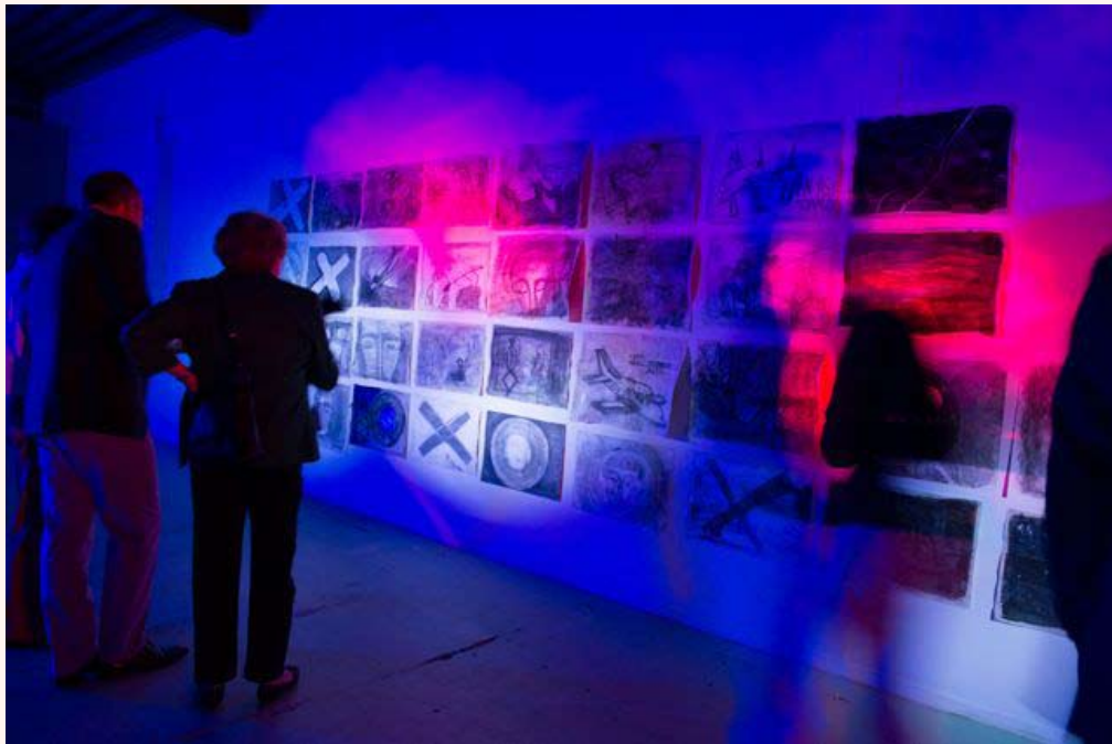
'In space, no one can hear you scream' Installatie in Loods 32 2013