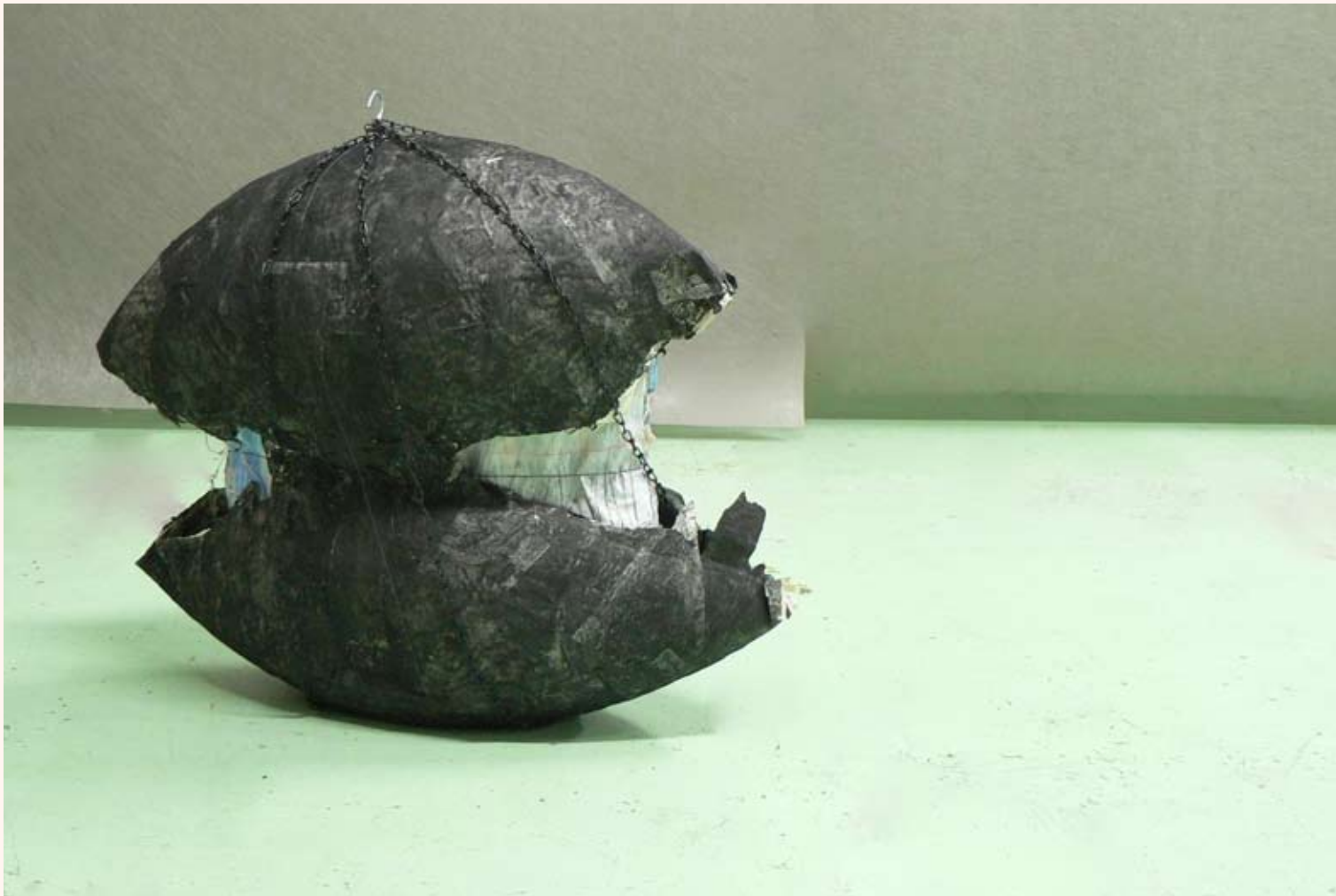
'In space, no one can hear you scream' Installatie in Loods 32 2013 Slot