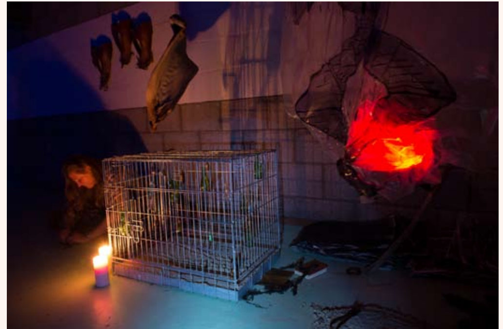
'In space, no one can hear you scream' Installatie in Loods 32 2013