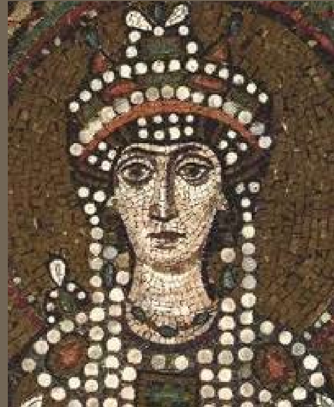
Theodora I (ca. 500 –548) was keizerin van het Byzantijnse Rijk, naast Keizer Justinianus I.

We zijn allang gestorven, ik iets langer al dan hij, maar tijdloos en vitaal blijft onze liefde.