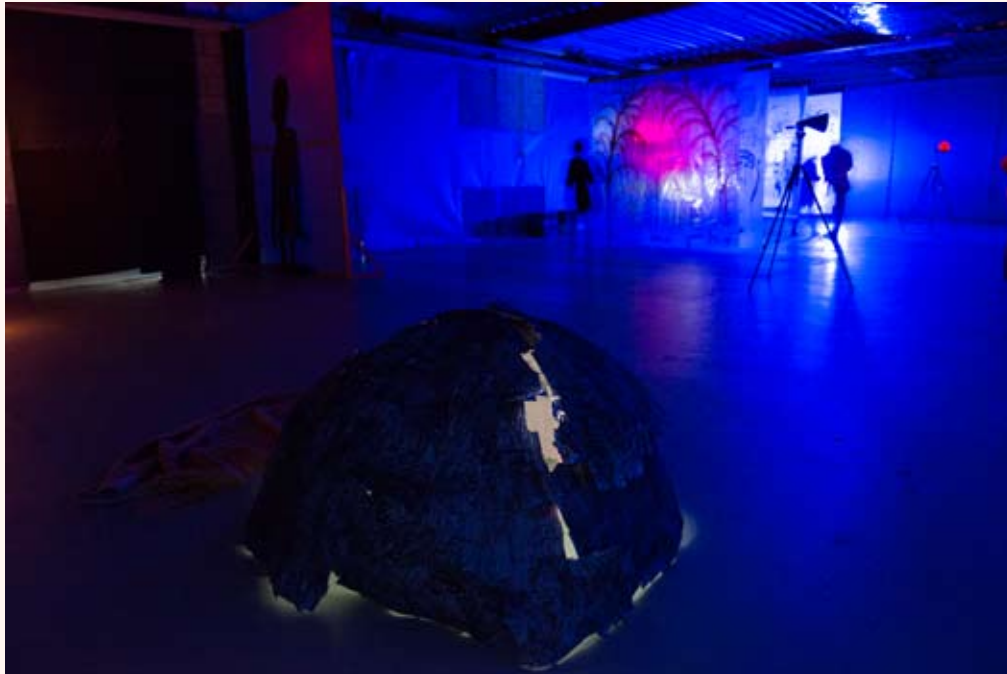
'In space, no one can hear you scream' Installatie in Loods 32 2013