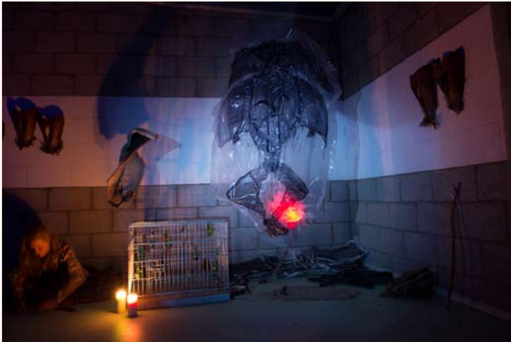
'In space, no one can hear you scream' Installatie in Loods 32 2013