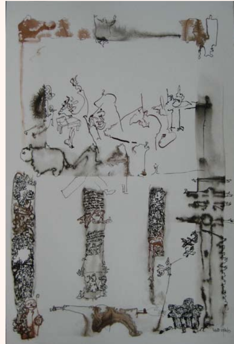
23 april 2013