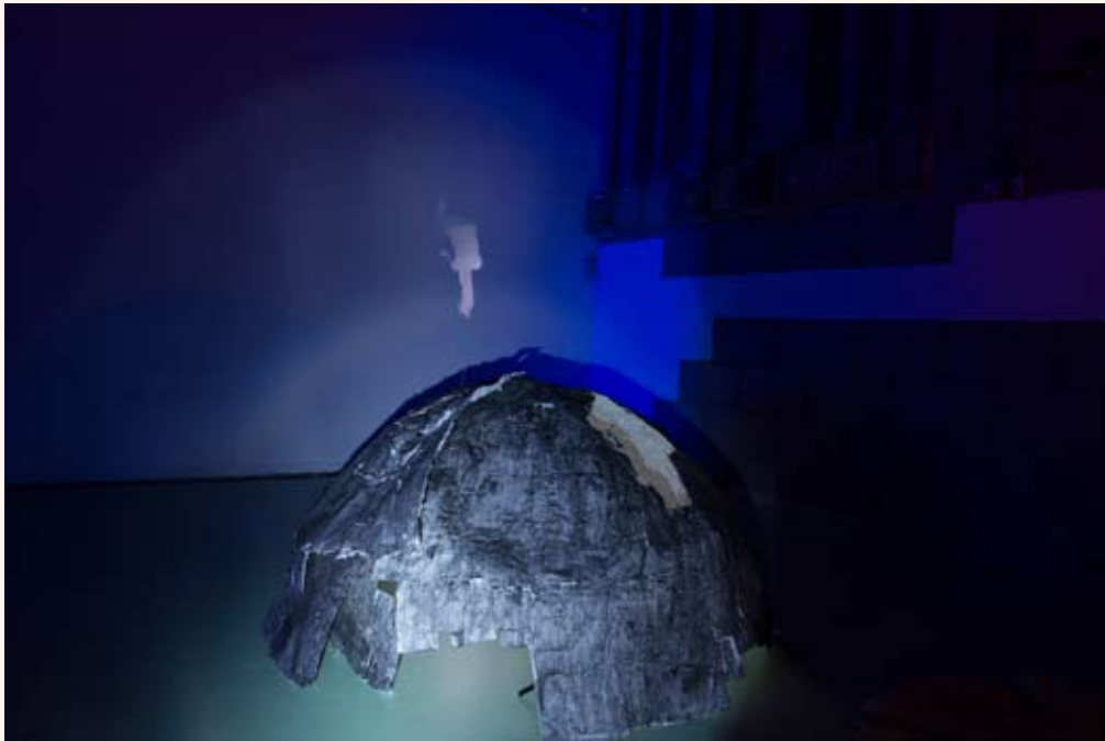
'In space, no one can hear you scream' Installatie in Loods 32 2013