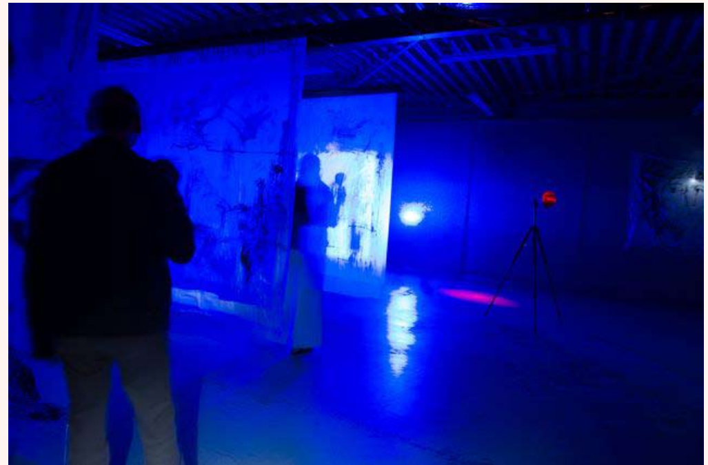
'In space, no one can hear you scream' Installatie in Loods 32 2013