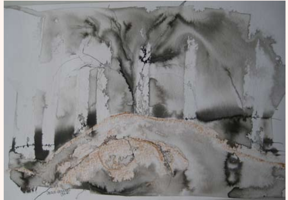
Onder aarde (lig ik)