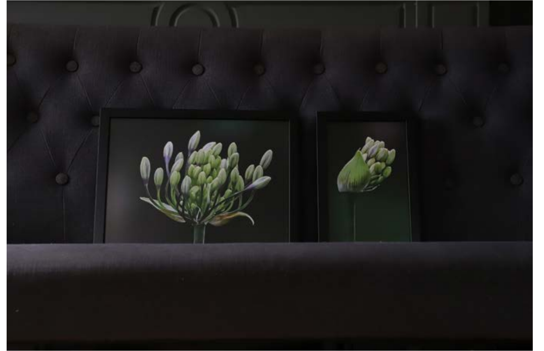
Agapanthus - tweeluik