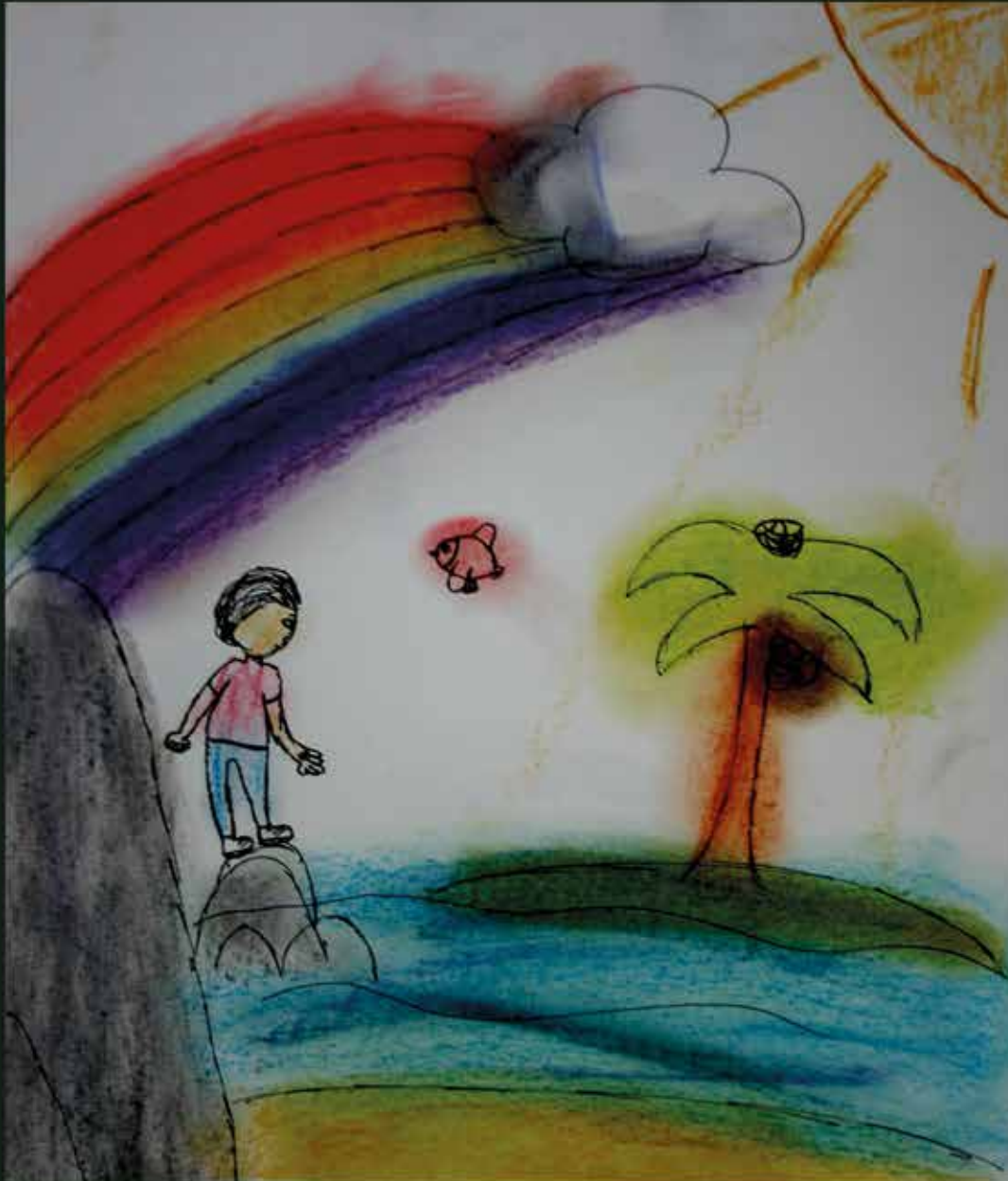
Tekening: Zobine Heemskerck - Gymnasium 1 - Baken Trinitas Gymnasium, Almere

In juni kom ik vrij, daags erna word ik 60 meteen ga ik me aanmelden bij The Voice Senior Ik kan niet wachten, zingen zal ik tot m'n dood