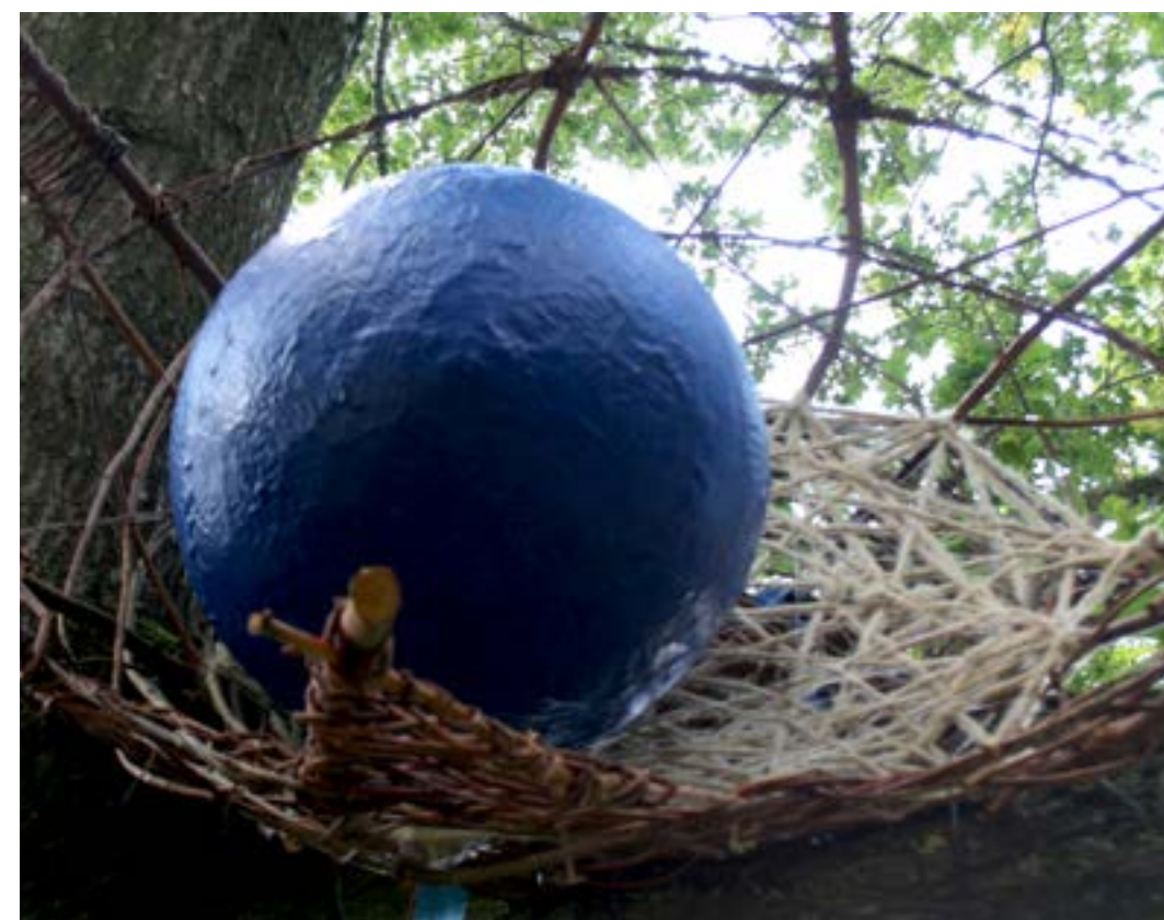
Beeld: Marijke Bolt

wie zal het licht bebroeden wie heeft wat in zijn mars