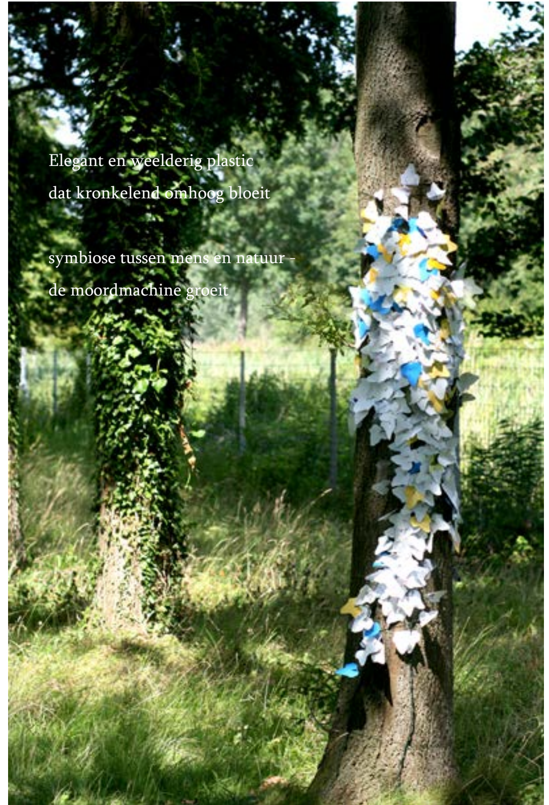
Beeld: Marisja van Weegberg

Elegant en weelderig plastic dat kronkelend omhoog bloeit