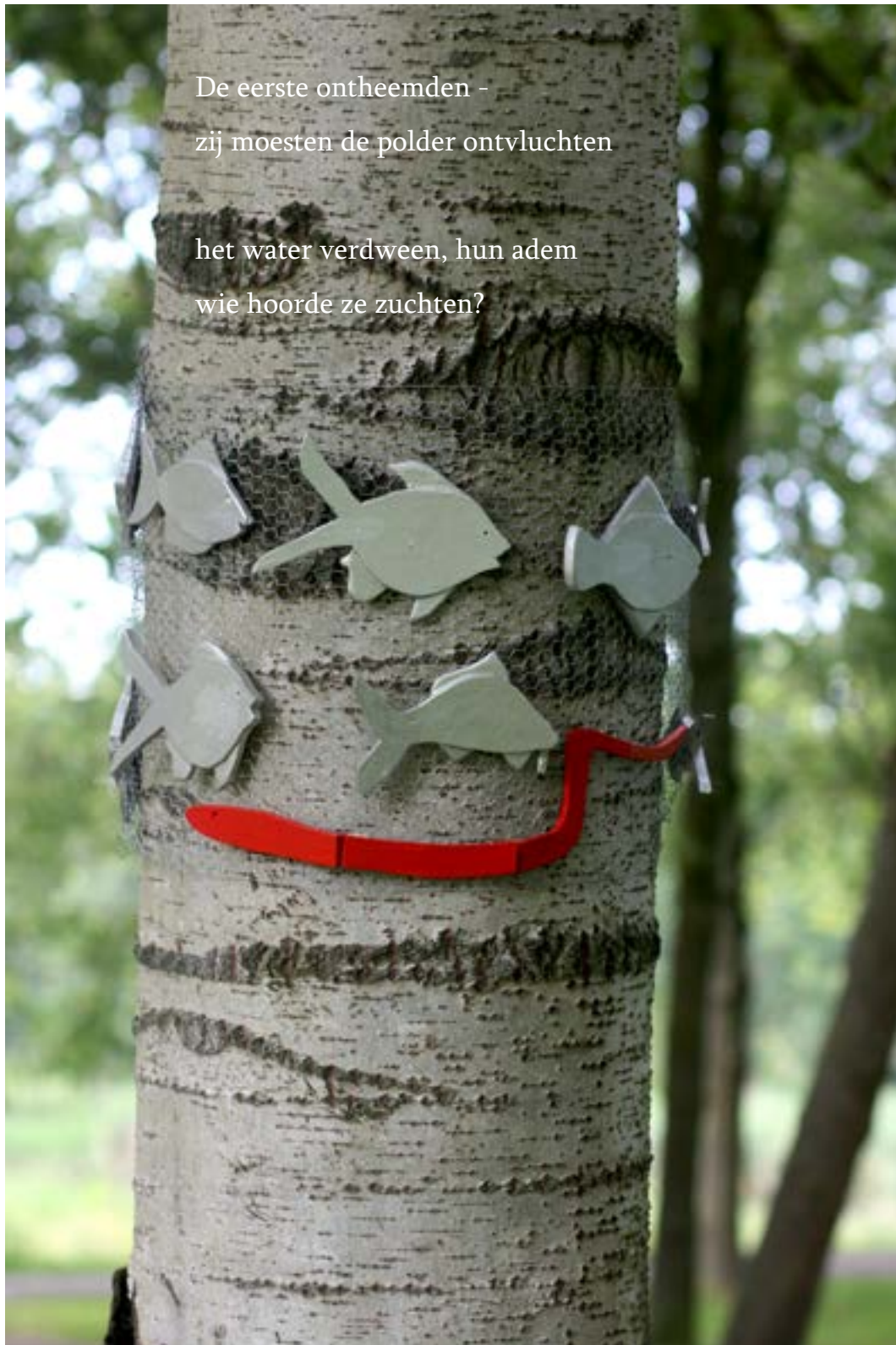
Beeld: Willem Hoogeveen

De eerste ontheemden - zij moesten de polder ontvluchten het water verdween, hun adem wie hoorde ze zuchten?